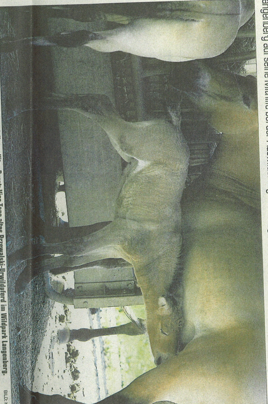
Auch ein Bewohner von Halbwüsten hat bei dieser Hitze Durst: Vier Tage altes Przewalski-Urwildpferd im Wildpark Langenberg.

Im Moment hat jedoch ein anderer Punkt Priorität: die Wiederauswilderung der Przewalski-Urwildpferde oder Takhis. Sie gelten zusammen mit dem im Mittelalter