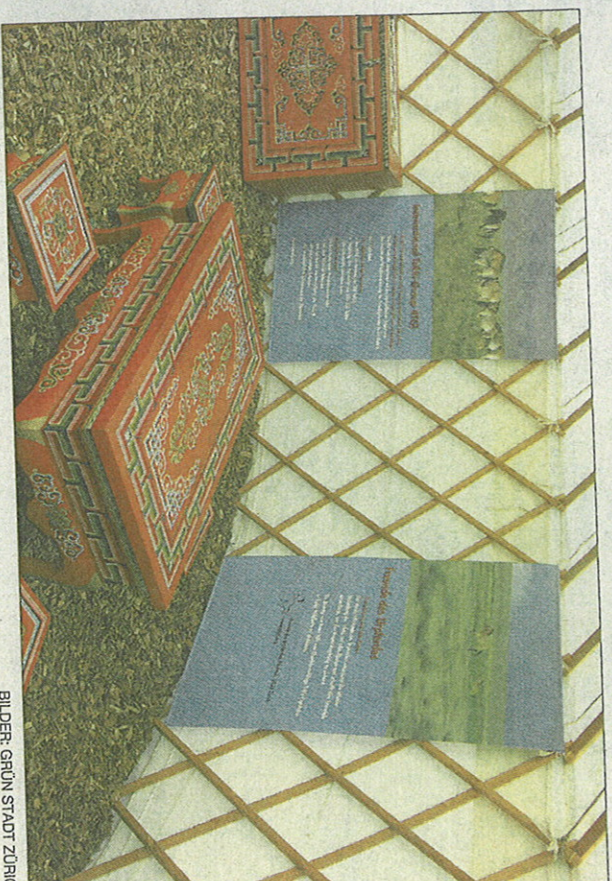
... und von innen.