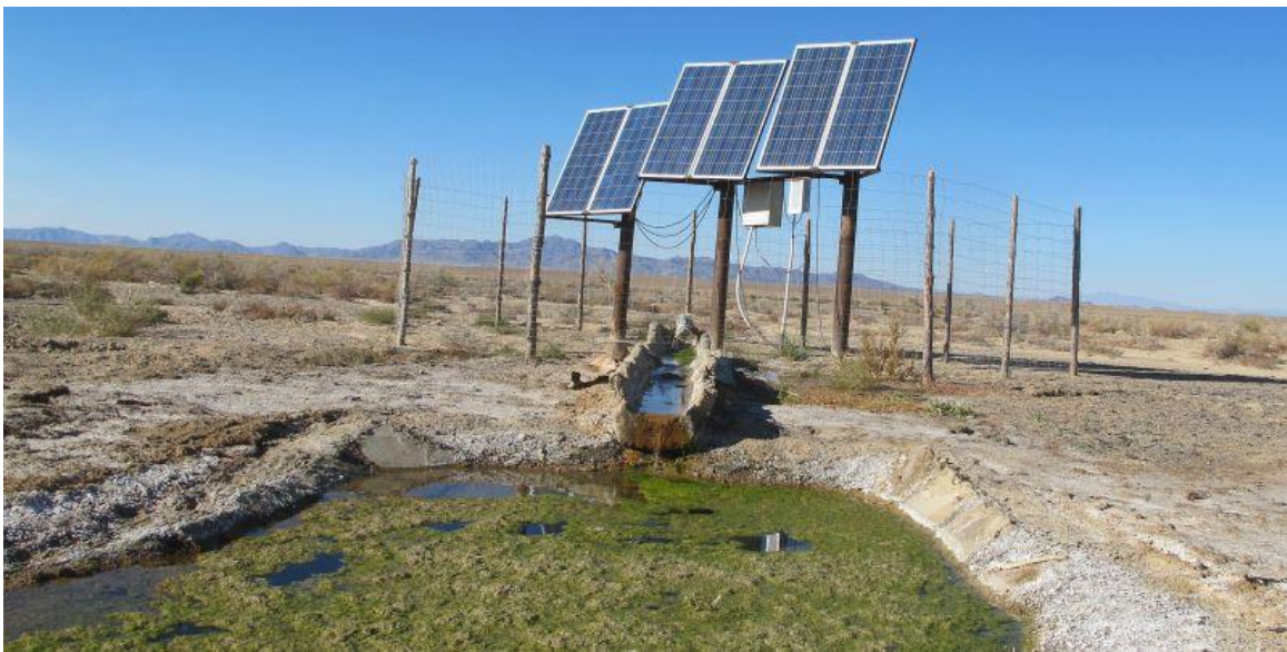
neuer, von der Regierung finanzierter solarbetriebener Brunnen

Ebenfalls im Frühling konnte ein solarbetriebener Brunnen in der Mitte des Parks in Betrieb genommen werden. Aufnahmen durch Fotofallen zeigen, dass der Brunnen von allen Wildtieren sehr gut angenommen worden ist. Eine der Takhi-Gruppen hat zudem ihr Streifgebiet dank der Wasserstelle wesentlich vergrößert. Im September wurden geologische Abklärungen für eine weitere artifizielle Wasserstelle in der Nähe von Takhin Tal getätigt.