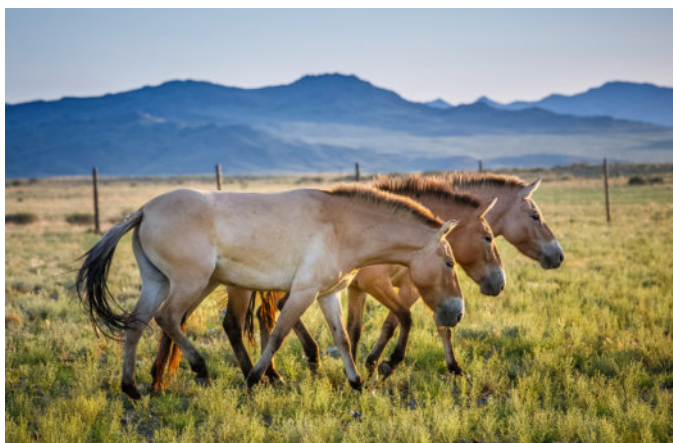
Landung der CASA der tschechischen Luftwaffe im Distrikthauptort Bulgan (Provinz Khovd). Sofort nach der Landung werden die Transportbehälter entladen und auf Lastwagen verfrachtet. Die erste Strecke der Reise von Bulgan ins Nationalpark-Hauptquartier Takhin Tal führt über eine Asphaltstrasse. Unbefestigte Strassen erreicht der Konvoi 3 Stunden nach dem Verlassen des Flughafens. Die Stuten im Eingewöhnungsgehege am nächsten Morgen: müde, aber wohllauf.