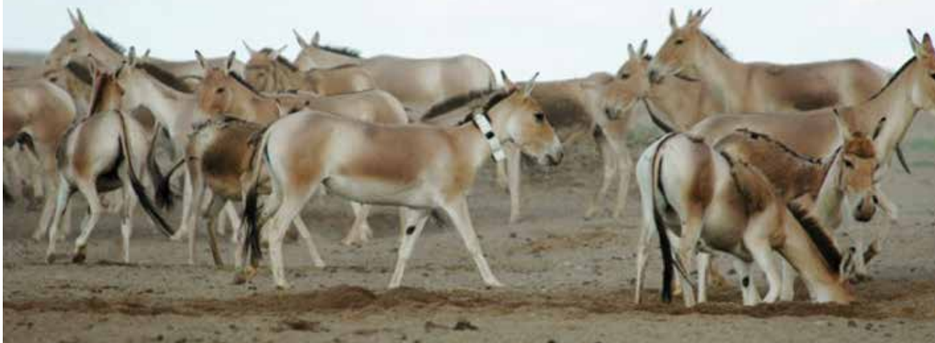
Өөрийн ухаж ус гаргаж авсан нүхэн дээр буй говийн хулан.

Говь цөлд амьдардаг хулан нь амьдрах, тэсвэрлэх маш гайхалтай чадвартай. Тал хээрийн өвсөөр хооллоод зогсохгүй, ургамал, сөөг, шүүслэг ургамал ( Zygophyllaceae )-аар хооллодог. Ширгэсэн гол, горхи булагт нүх гарган ундаалдаг ба бусад амьтад ч ундаалах боломж олгодог байна.