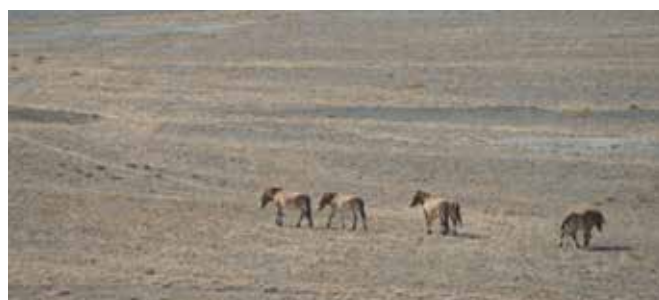
“Хустай Байгалийн Цогцолборт газар”-ын тахийн бэлчээр (Монголын хойд хэсэг, дээд талын зураг), Говийн Их Дархан Цаазат Газрын “Б” хэсэг (дунд талын зураг) болон Каламайли Хамгаалалтын Бүс (БНХАУ-ын Шиньжан муж, доод талын зураг) нь хоорондоо их ялгаатай.