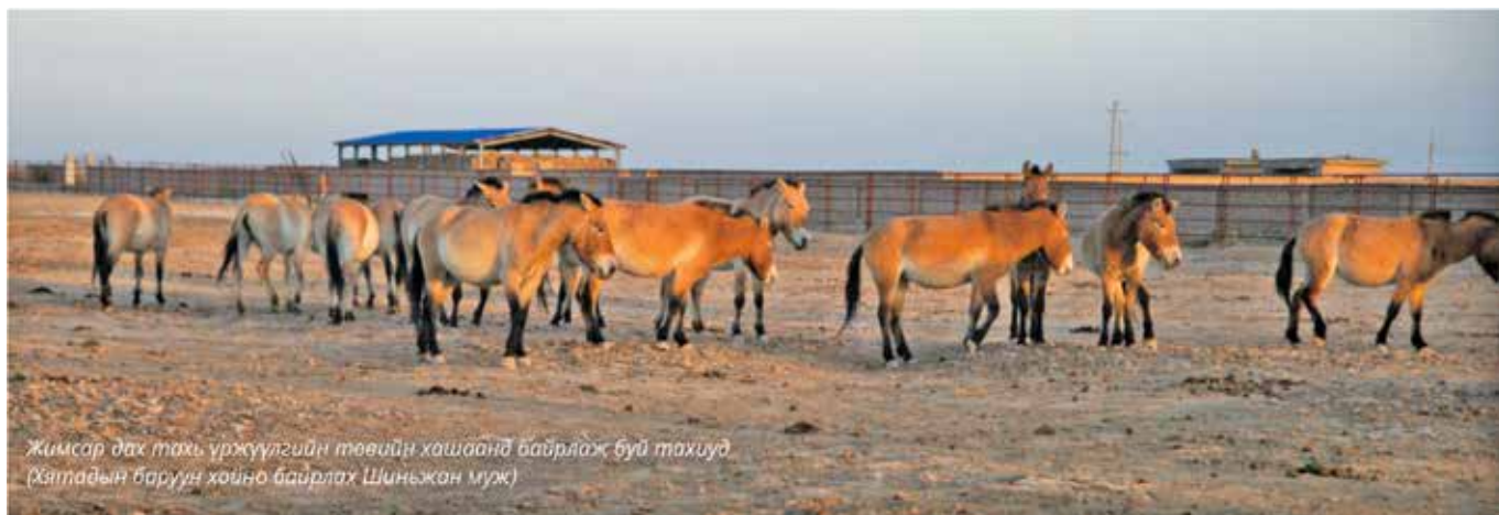
Жимсар дахь тахь үржүүлгийн төвийн хашаанд байрлаж буй тахиуд (Хятадын баруун хойно байрлах Шиньжан муж)

Энэ жил говьд болох Монгол-Хятадын тахь хамгаалагч нарын хамтарсан сургалтыг ихэд сонирхож байна.