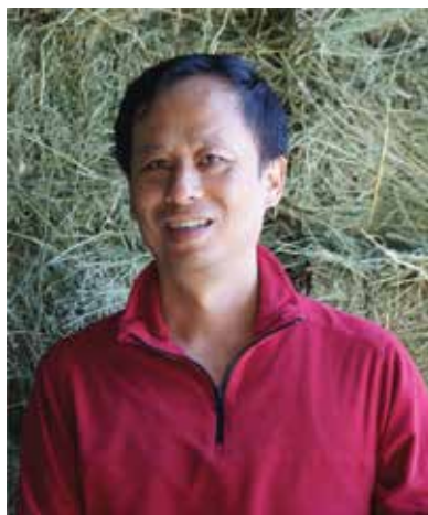
Шиньжаны “Экологи, Газарзүйн Институт”-ын профессор