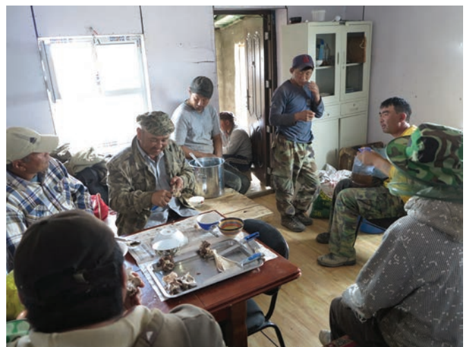
Хашаа барих хүнд ажлын завсарлага- өдрийн хоолны үеэр