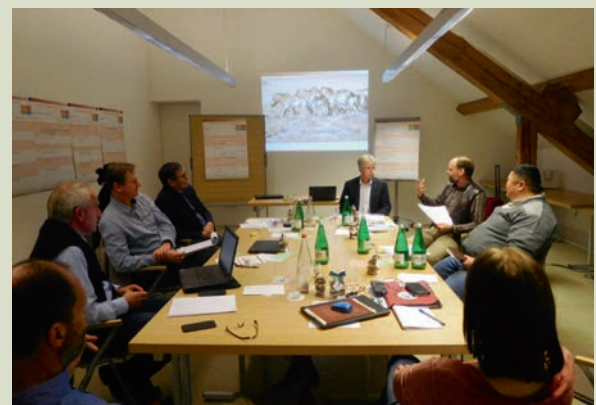
Судалгааны ажлын төлөвлөгөөг хэлэлцэж буй ажлын хэсэг.